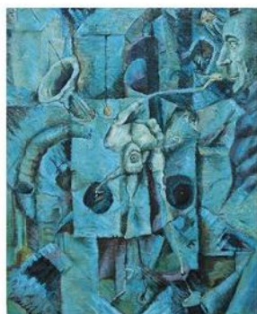
PEINTURES DE MARTIN CAUVEL

VENDREDI 14 OCTOBRE – 18H À LA MÉDIATHÈQUE DE FONTÈS – EXPOSITION DE PEINTURE DE MARTIN CAUVEL DU 11 AU 26 OCTOBRE : VERNISSAGE ET RENCONTRE AVEC L'ARTISTE – CONCERT AVEC SAMUEL COVEL – APÉRITIF CONVIVIAL